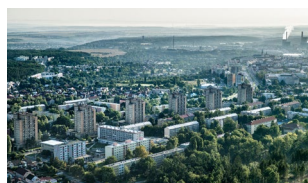
Kladno - CZ

Risikohinweis: Investitionen sind mit Risiken verbunden. Der Wert der Investition kann im Laufe der Zeit schwanken (sowohl fallen als auch steigen), und die Rückzahlung des investierten Kapitals ist nicht garantiert. Bitte schenken Sie der Risikobeschreibung im Fondsstatut sowie dem wesentlichen Informationsdokument (KID) besondere Aufmerksamkeit. Die historische Wertentwicklung der jeweiligen Investition ist kein verlässlicher Indikator für zukünftige Erträge. Die Investition ist möglicherweise nicht geeignet für Anleger, die planen, ihre investierten Mittel innerhalb von weniger als 5 Jahren zurückzuerhalten.