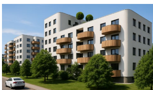
Dúbravka (BA) - SK